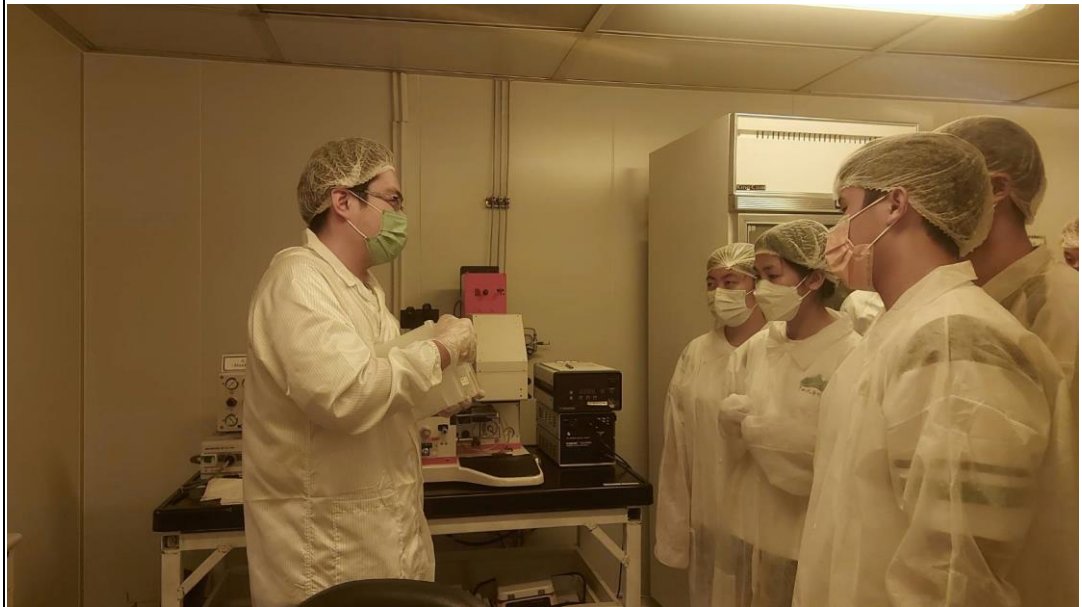
說明：參觀電機系無塵室