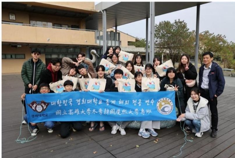
南韓慶熙大學 (Kyung Hee University) 師生對高雄行印象深刻。

國立高雄大學姊妹校、南韓慶熙大學 (Kyung Hee University) 師生日前造訪高大校園，展開為期2周的台灣文化研習與走讀之旅。由於台灣南部相對於南韓而言相對溫暖，慶熙大學學生也享受了南部舒適氣溫。