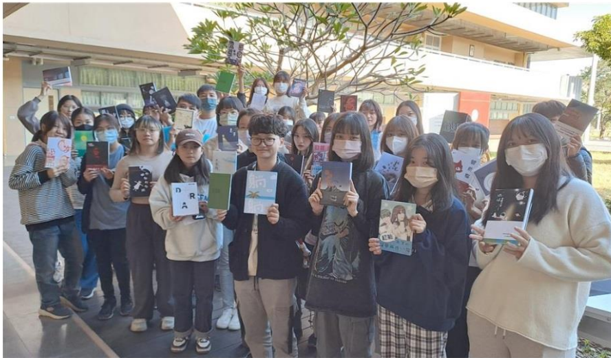
國立高雄大學藝創系師生日前舉辦一日書展，展現學生設計的書籍封面。