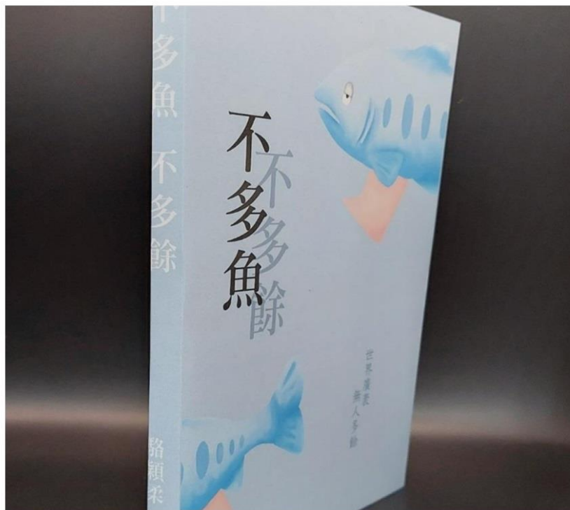
國立高雄大學藝創系學生設計《不多魚、不多餘》，充滿禪意。

什麼樣的書名與書籍封面設計，會吸引民眾目光？國立高雄大學藝創系兼任講師蔡雪麗日前以《給自己的一本書》為主題，帶領學生實際體驗專業出版流程，透過校園一日書展呈現學生的設計成果。學生設計的書本封面相當多元，有勵志，也有禪意。