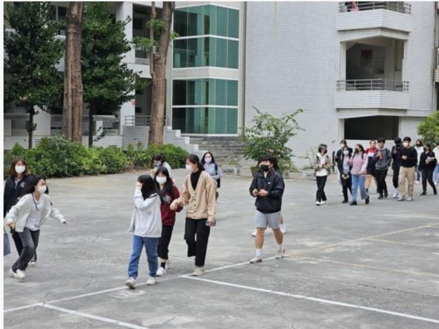
「113學年度大學學科能力測驗（113學測）」二十二日進入第三天試程，考生們考完輕鬆步出校園。

「考完了！」「113學年度大學學科能力測驗（113學測）」二十二日進入第三天試程，上午考科數學B，下午進行社會考科。國立高雄大學負責高雄三考區的中山高中與左營高中分區試場，該二科缺考人數各為八十七、九十人，順利結束。