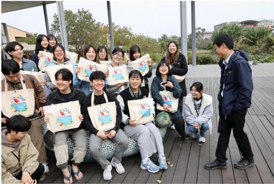
高雄大學東語系主辦南韓姊妹校慶熙大學師生來台文化研習、走讀。