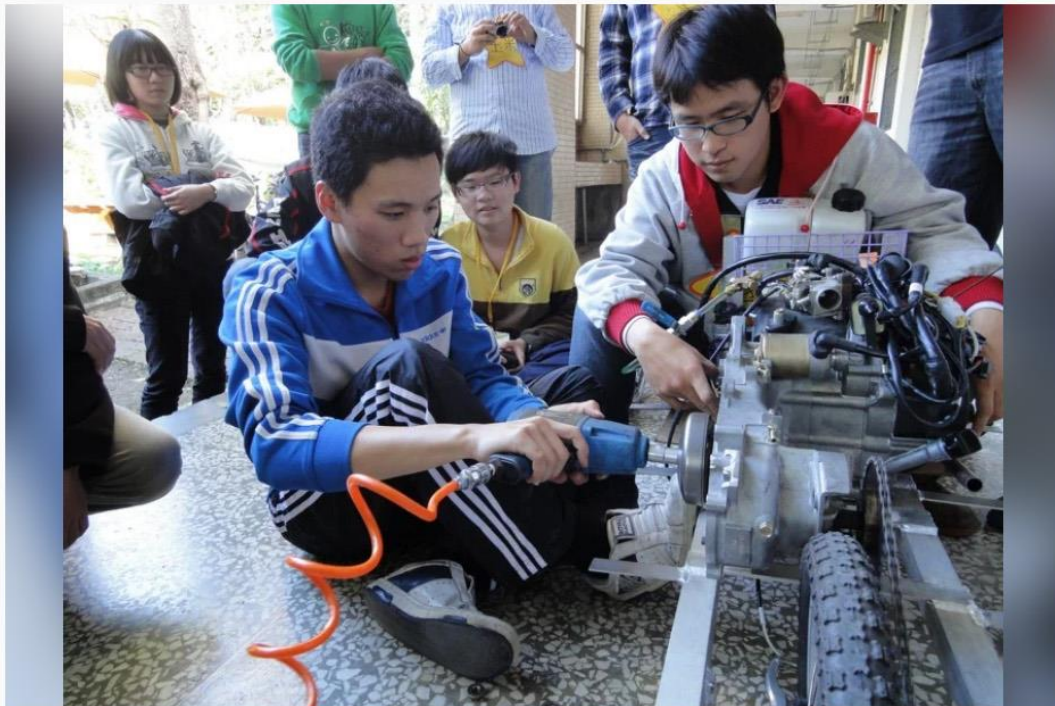
台灣國立大學系統整合中南部11校整合資源，提供考生選擇更多。