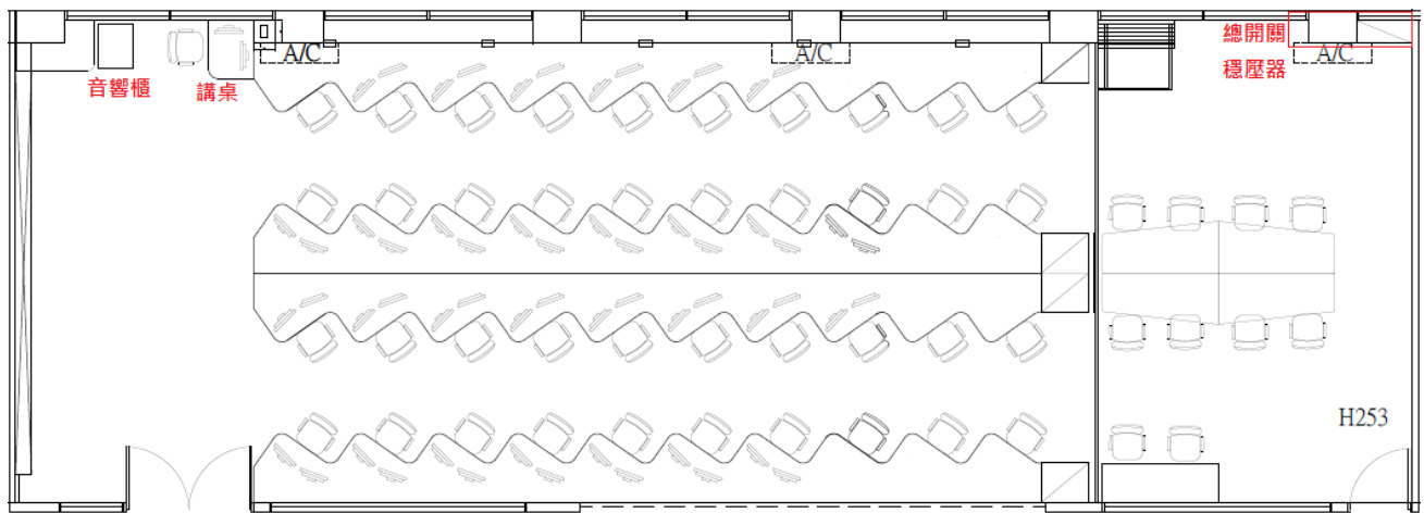
圖資 610 電腦教室平面圖