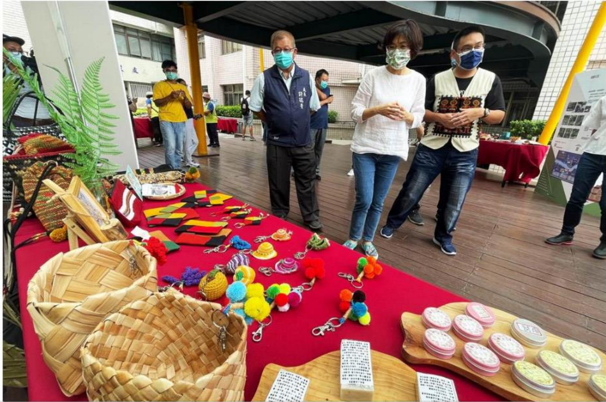
台東縣長饒慶鈴參觀社區規畫師培力計畫成果展，期許種子社區在台東各角落成長。