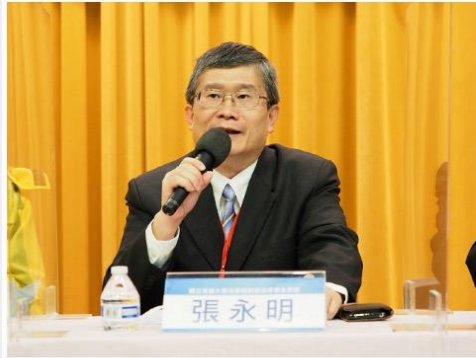
【記者晨曦／台北報導】

《世界人權宣言》序言提及「鑒於對人類家庭所有成員的固有尊嚴及其平等和不移權利的承認，乃是世界自由、正義與和平的基礎」。