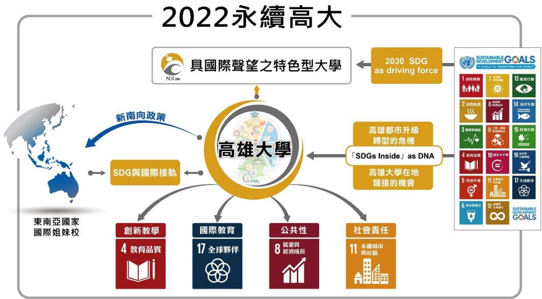
【圖 1】國立高雄大學以融入「SDGs-Inside」為導向之校務中程計畫之架構

因此，在最新 107-111 年校務中程發展規劃上，除了導入對大學社會責任與高教公共性的實踐外，更揭櫫了高雄大學追求改變，推動整體體質轉型的核心構想：對於國際聲望的願景，對內建立以 SDGs（Sustainable Development Goals）在地詮釋（Glocalization）作為本校體質調整的目標，全面追求關鍵目標的實現和體制的改變，對外推動結合國際夥伴（東南亞大學）共同合作詮釋 SDGs、共同成長的策略（圖 1）。我們提出以將 SDGs 內化至高雄大學之中（「SDGs-Inside」），作為驅動全校改變動力的行動指引，配合行政院「數位國家・創新經濟發展方案」及 5+2 前瞻產業，培育國家政策所需特色人才，藉由「SDGs-Inside」接軌國際，落實教學創新與提升教育品質、發展高大特色、提升高教公共性及實踐大學社會責任等主要目標。