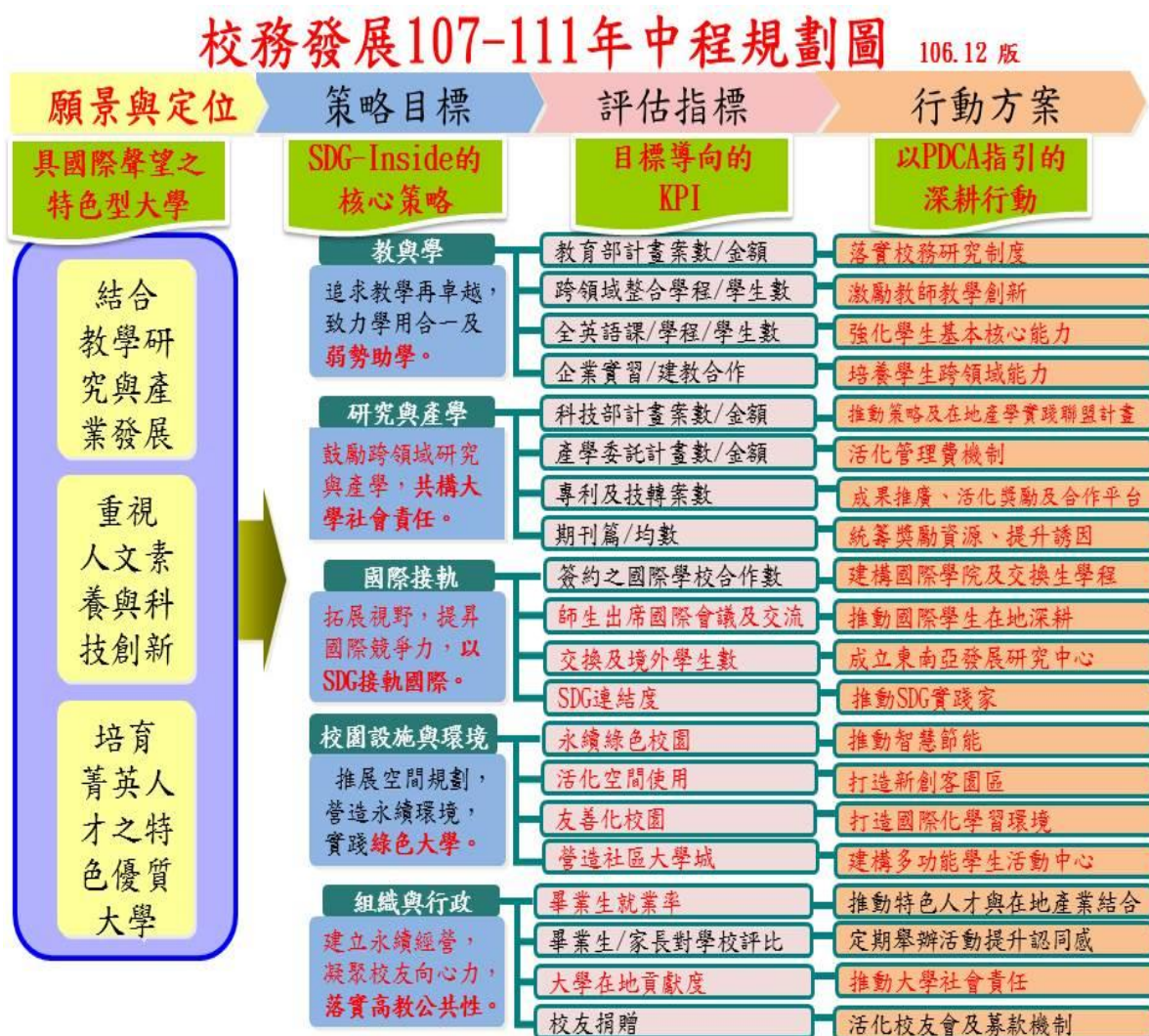
【圖 2】校務發展 107-111 年中程規劃圖

此外，為有效提升學生就業力、落實教學精緻化與人才培育優質化目標，本校也積極透過教育部「102-104 年教學增能計畫」及「獎勵大學院校辦理區域教學資源整合分享計畫-高東屏區域教學資源中心」之計畫經費挹注，完備各項基礎建置、善用產業區位優勢、厚植學生基礎能力、發展生涯學制度及深耕東亞高等教育交流等面向，也因此獲教育部肯定，榮獲 104-106 年教育部教學卓越計畫 3 年共 9,000 萬之補助款，以及弱勢起飛計畫、區域文化經貿人才養成計畫（泰語）、泰語磨課師計畫、國際經貿談判人才培育計畫（英語）、大學提升校務專業管理能力計畫、再造人文社會科學教育發展計畫、學伴計畫、教學創新試辦計畫（1,700 萬）等。