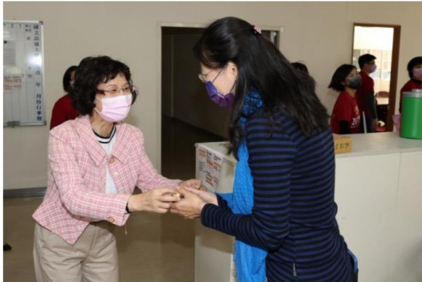
高雄大學校長陳月端（左）走訪校內各單位，向女性教職員致意感謝，贈以女性限定祝福巧克力。

「各位姊妹同仁辛苦了！」國立高雄大學響應國際婦女節，校長陳月端今（8）日走訪校內各系所、處室、中心向女性教職員致意感謝，贈以女性限定祝福巧克力，慰勉職場及家庭的付出、辛勞，也提醒記得疼惜自己、重視自己。