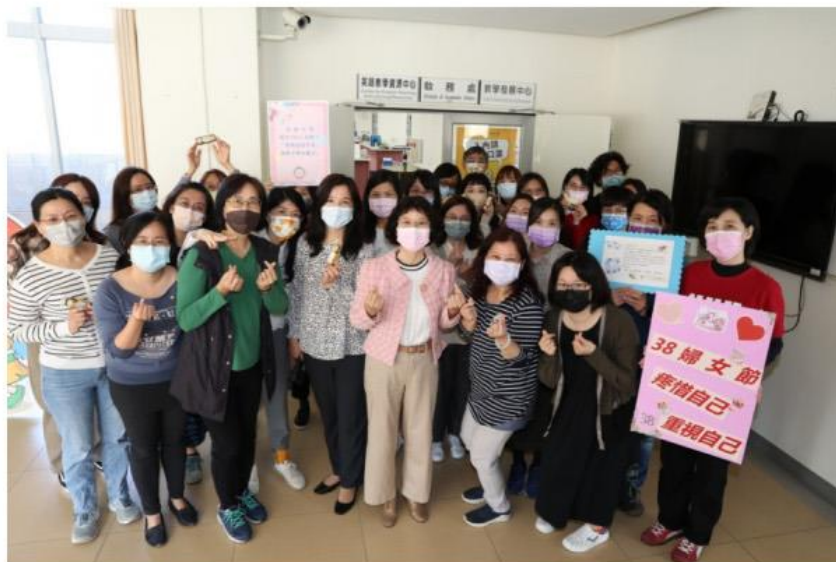
高雄大學女性教職員合影慶祝婦女節。

「各位姊妹同仁辛苦了！」國立高雄大學響應國際婦女節，校長陳月端今（8）日走訪校內各系所、處室、中心向女性教職員致意感謝，贈以女性限定祝福巧克力，慰勉職場及家庭的付出、辛勞，也提醒記得疼惜自己、重視自己。