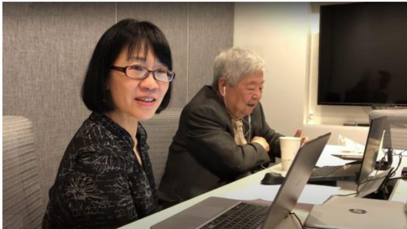
▲中華企業倫理教育協進會協助倫理教師數位化，讓教學更有趣。

看韓國電影「82年生的金智英」，也能學倫理。去年因疫情緣故，短時間內所有學校改採遠距教學，老師兵荒馬亂，學生學習大打折扣，但是中華企業倫理教育協進會因應疫情變化教導倫理教師「數位化」，透過線上桌遊、追劇學倫理、情境扮演等創新教學內容，手把手傳授老師們數位教學的訣竅，以抓住學生們的眼球，彌補線上難以專注與無法實體互動的缺點，在實體課程停擺的情況下，反倒成為倫理教育數位轉型的新契機。