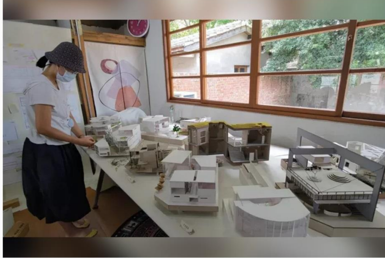
高雄大學建築學系於「黃埔新村」舉辦學生學習成果展。