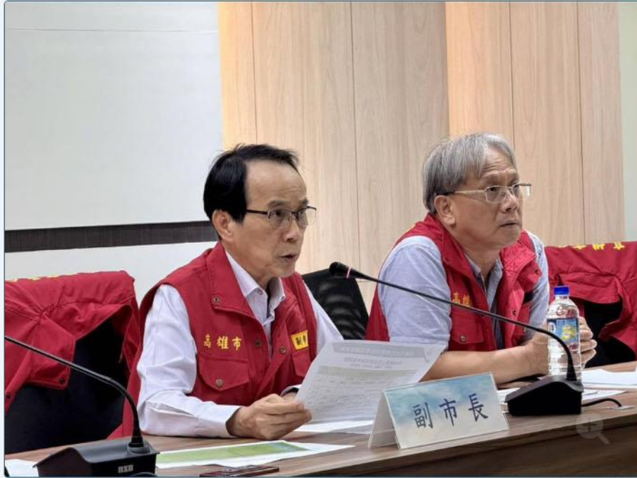
高雄市政府副市長林欽榮今（12）日前往水情中心聽取簡報，掌握防颱整備情形。

面對楊柳颱風來勢洶洶，高雄市政府副市長林欽榮今（12）日前往水情中心聽取簡報，掌握防颱整備情形。他指示山區實施預防性撤離，並參酌0728豪雨事件經驗，針對非土石流保全戶但因災情需撤離者，同時提醒各地須嚴防沿海低窪地區海水倒灌。