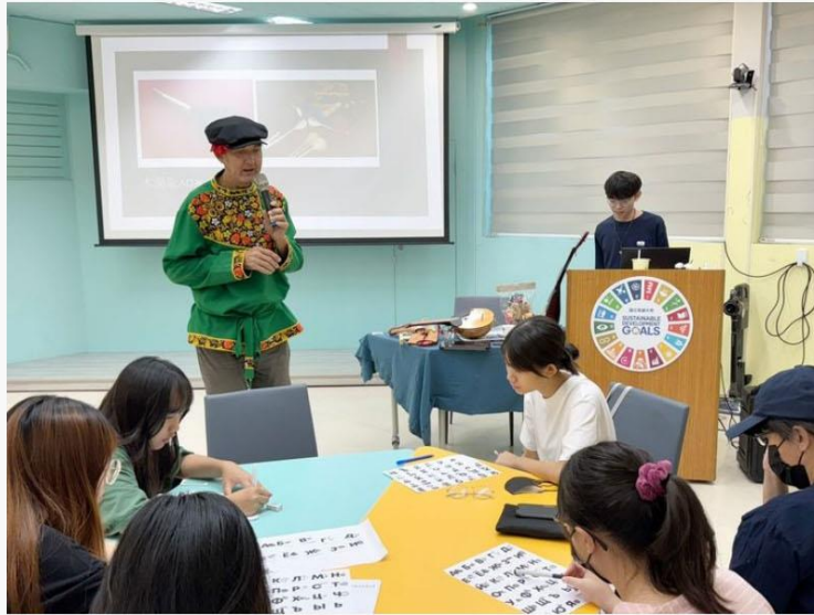
國立高雄大學「來高大過暑假」營隊今年以「新二代共學——探索俄羅斯 捲起袖子當Maker」為主題，十一至十五日在校內舉辦，邀請對俄語與文化有興趣的高中生及新住民子女參與，透過語言、文化與科技實作，開啟跨文化學習與自我探索之旅。

國立高雄大學「來高大過暑假」營隊今年以「新二代共學——探索俄羅斯 捲起袖子當Maker」為主題，十一至十五日在校內舉辦，邀請對俄語與文化有興趣的高中生及新住民子女參與，透過語言、文化與科技實作，開啟跨文化學習與自我探索之旅。